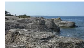
Rauker ved Byrum

Afgang fra hotellet kl. 9.00. En dag med spændende naturoplevelser ligger foran os. Vi er hurtigt fremme ved den 6 km lange Ølandsbro, der blev indviet i 1972. På Øland kører vi mod nord, hvor første stop er Borgholm Slotsruin, som ligger tæt ved kongefamiliens sommerslot, Solliden. Efter at have drukket formiddagskaffe kører vi videre op til byen Byrum for at se et spændende naturområde med nogle fantastiske kalkstensformationer (rauker) ude ved kysten. Herfra fortsætter turen tværs over øen til Löttorp, hvor vi skal spise frokost. Derfra kører vi videre mod syd gennem bl.a. Störlinge, hvor stubmøllerne ligger på stribe. Hvis tiden tillader det, slutter vi turen på Øland med at se jernalderborgen Ismanstorp.