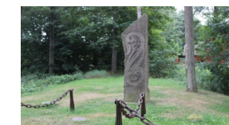
Fredsstenen i Brømsebro

Kl. 9.00 forlader vi hotellet og kører til Brømsebro, hvor vi har et kort ophold ved Fredsstenen, der blev sat op til minde om freden i Brømsebro. Det er også her, vi drikker formiddagskaffe, inden turen fortsætter til Karlskrona, hvor vi skal se Admiralitetskirken - en af Sveriges ældste trækirker. Derefter er der afsat tid til lidt sightseeing fra bussen rundt i byen, inden vi spiser frokost på restaurant "Utkiken", som ligger med en fantastisk smuk udsigt ud over landskabet. Hjemturen starter kl. 14.30, og foran os ligger en køretur tværs over Skåne til Øresundsbroen og videre tilbage til Ringsted. I alt en tur på 3-4 timer inkl. en pause.