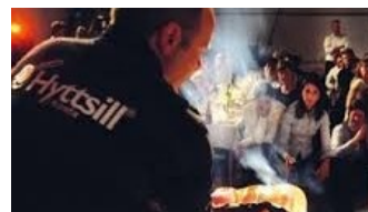
Hyttisill i Pukeberg