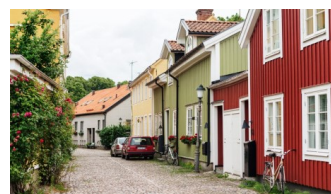
Gamle bydel i Kalmar