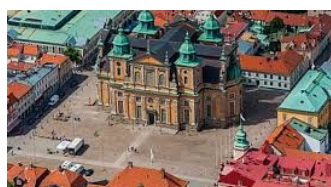
Domkirken i Kalmar