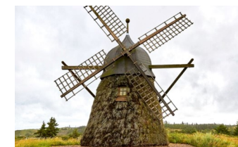
Lyngmølle på Grønnestrand