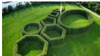
De geometriske haver