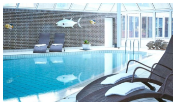
Mulighed for en svømmetur