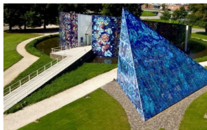
Carl- H. Pedersens Museum