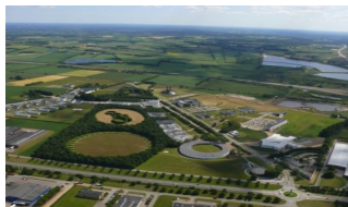
Udsigt over Birk Center Park