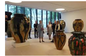
Middelfart Fajance Museum