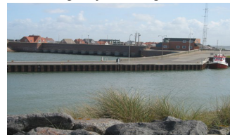
Slusen i Thorsminde