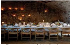
Restaurant på Koldinghus