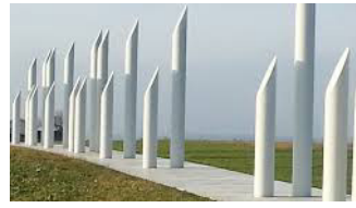
Palisadehegnet i Jelling