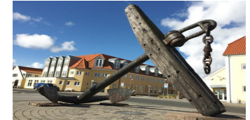
Ankeret på Thyborøn havn